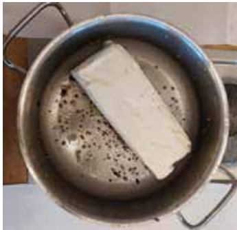
1. Pflanzenfett schmelzen,

Bei dieser Aktion durften die 1b und die 3a unter der Anleitung von Frau Stadlinger Futtertassen für die Winterfütterung von Vögeln herstellen. Vögel sollten nur bei richtig kaltem Wetter von November bis Februar gefüttert werden. Besonders geeignet sind die Futtertassen, weil diese nicht durch den Kot der Vögel verunreinigt werden können. Wichtig ist es, die Tassen katzensicher aufzuhängen. So einfach kann man Futtertassen machen: