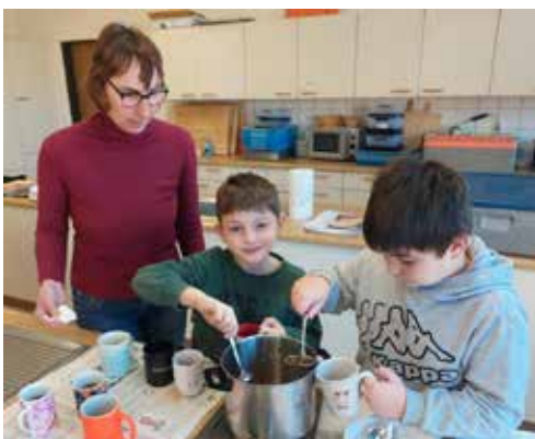
3. etwas abkühlen lassen und dann in Behälter füllen – fertig!