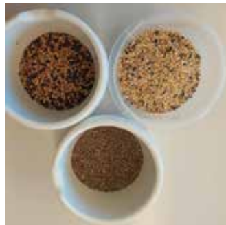
2. Vogelfuttermischung einrühren,